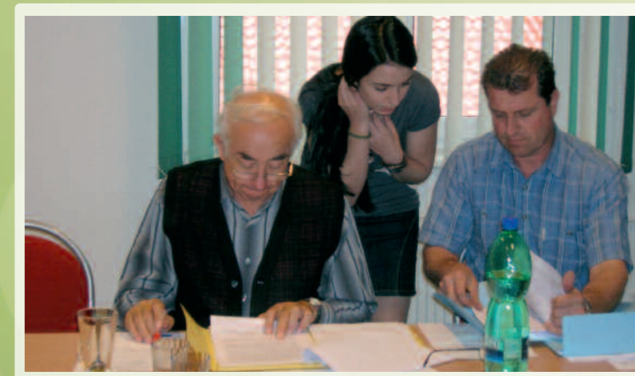
Zasedání výběrové komise