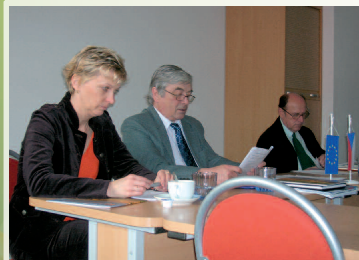
Jednání Valné hromady MAS