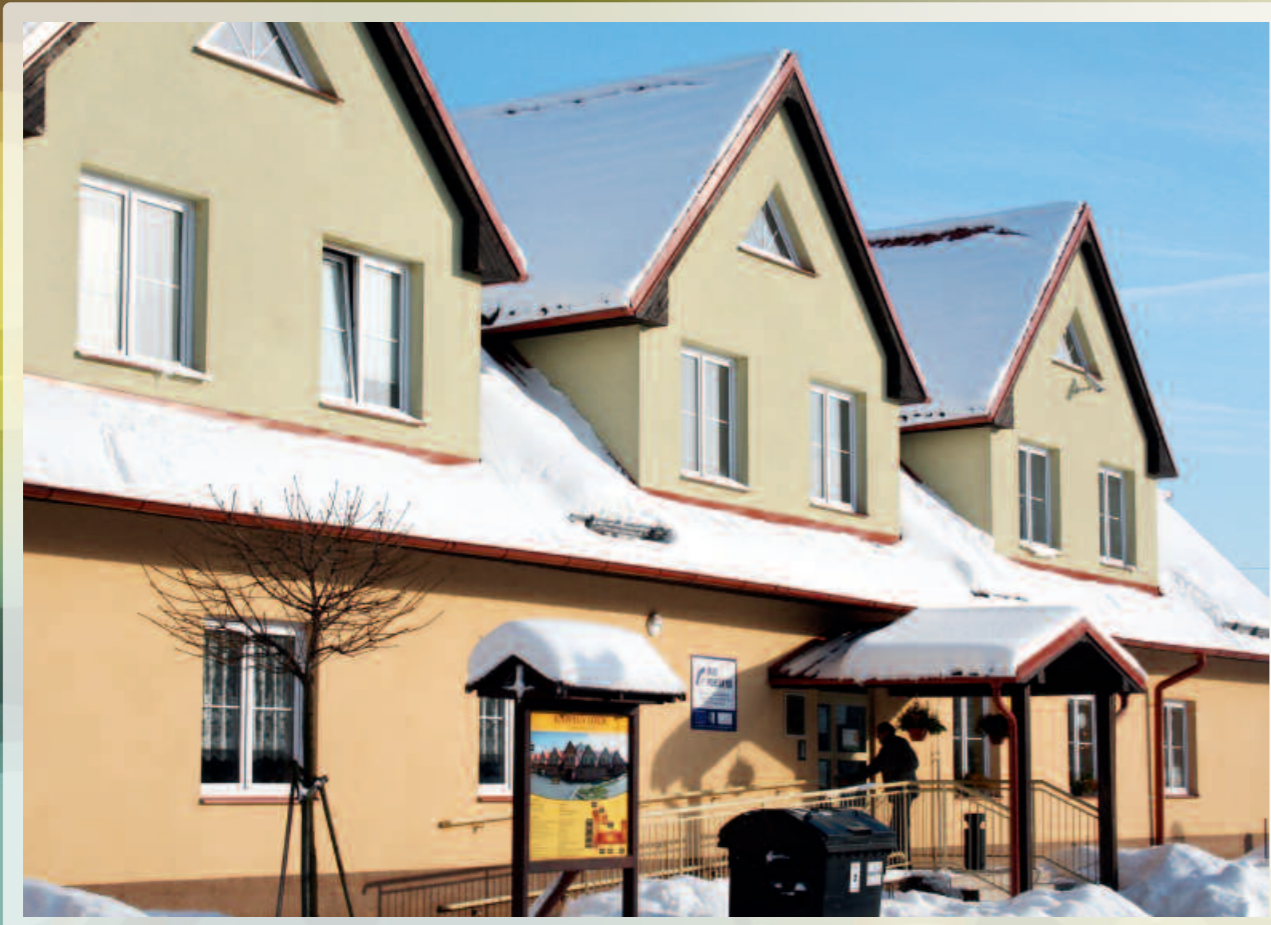
Sídlo MAS Pobeskydí