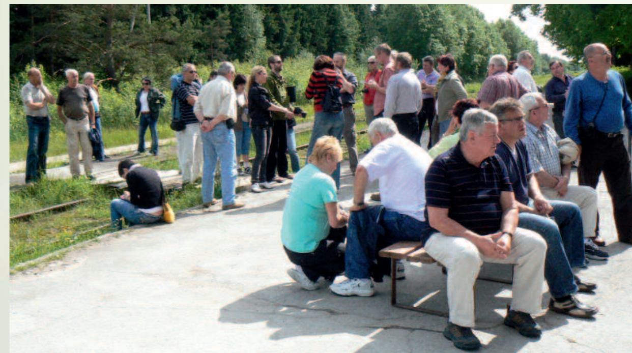
Cesta za poznáním ...

Pořadatel: CP SZIF Praha Místo: Praha Datum: 7. 10. 2010